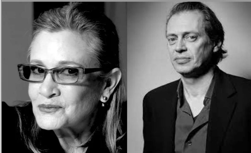
Mr & Mrs JONES, les parents de Teresa. Retraités.

TEST de Bibliothèque: Les PJ peuvent se renseigner plus en détail et découvrir que le Dr BRATFORD est un fervent catholique et que cela biaise son jugement en ce que les pêcheurs doivent être punis. Preuve en est, il est membre du conseil dirigeant d'une association extrémiste sur la pureté de l'âme dans l'attente du paradis éternel.