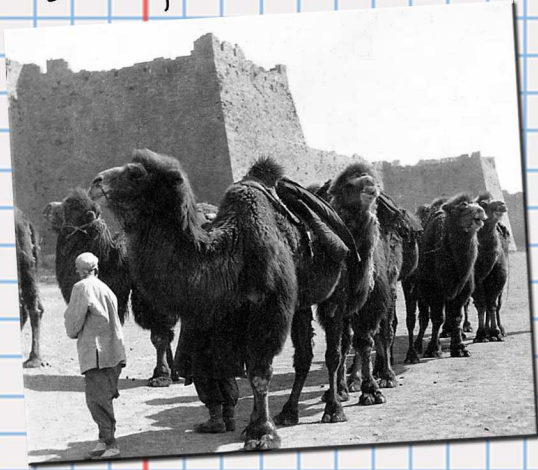
Passage de la frontière nord de la Chine.