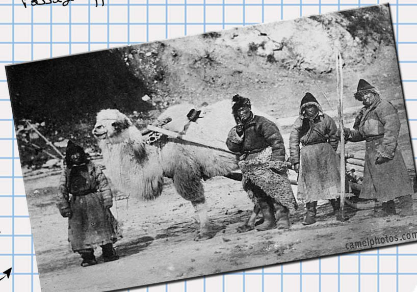
Passage difficile d'un ravin en montage.