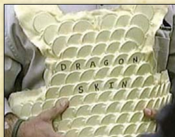
Détail de la structure interne

*Pour de plus amples informations se référer à la page 43 du Manuel des Armes