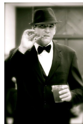
Mode femme et homme dans les années 20, Joséphine Baker

Aux US : on nomme cette période "Roaring Twenties", elle manifeste une position dominante du pays sur la scène internationale après la Grande Guerre. La même évolution culturelle et économique s'y produit, mais sous fond d'opinion publique divisée (conservatisme s'oppose au moderne). Le bolchévisme, l'anarchisme, le syndicalisme sont vus comme contraires aux valeurs américaines et réprimés. Retour en force du Ku Kux Klan, prohibition causant plus de criminalité (speakeasies clandestins, contrebande d'alcool par les Bootleggers organisés en mafias, le plus célèbre étant Al Capone). Urbanisation exponentielle avec de plus en plus de gratte-ciel, avènement de la consommation de masse qui va de pair avec la publicité.