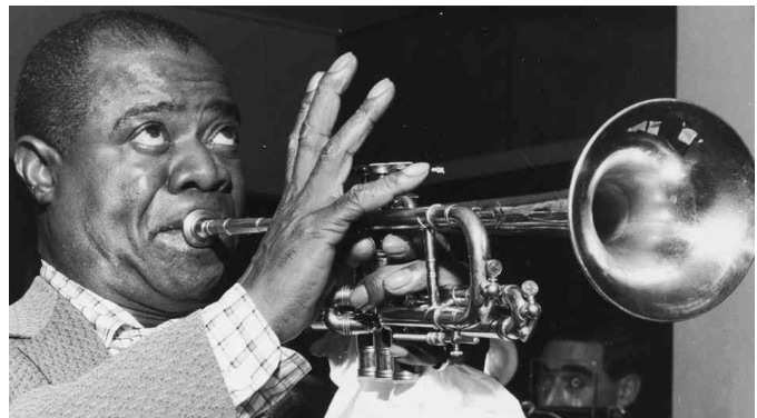
Louis Daniel Armstrong

En ces temps loin de notre époque moderne, il reste encore de nombreux mystères à résoudre... Einstein est en pleine réflexion. Aucun homme n'est jamais allé dans l'espace. L'univers hors de notre système solaire, les plus hauts sommets terrestres et les océans profonds restent encore à explorer. Les terres Arctiques et Antarctiques commencent à peine à être bien connues. Certaines contrées en Asie et loin de nos colonies africaines sont très rarement visitées par les hommes blancs, voire difficiles d'accès avec les moyens de l'époque. La génétique en est à ses balbutiements et dans certains contrées lointaines, des rites païens mystérieux continuent de vivre dans le secret, loin de la célébration d'après-guerre et de la modernité naissante de nos sociétés... Bienvenue dans les années 20. Des aventures vous attendent. Qui sait ce que vous pourriez encore découvrir que la science n'a pas encore prouvé... ou réprouvé.